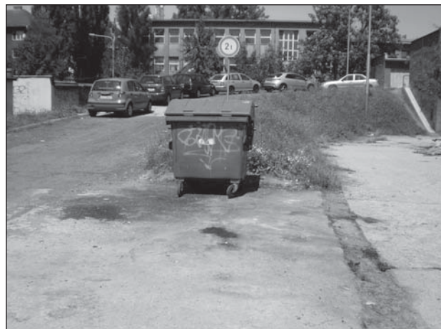
Garáže Fr. Šrámka po úklidu