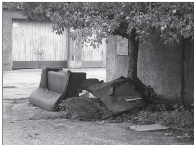
Garáže Fr. Šrámka před úklidem

Pozn. redakce: těsně před vydáním Zpravodaje u garáží Fr. Šrámka roste nová černá skládka. Věřte – nevěřte.