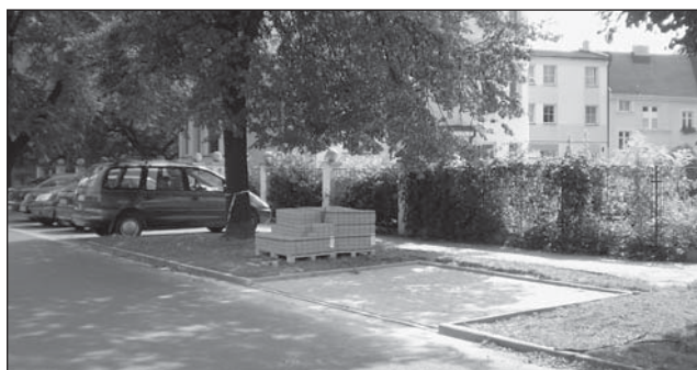
Kontejnerová stání Novoveská – Vršovců – Korunní.

Na ulici Zelené je v plném proudu rekonstrukce komunikace. Je to místní komunikace II. třídy, po které jezdí místní hromadná doprava, a proto je ve správě Ostravských komunikací. Od července do poloviny srpna prováděla